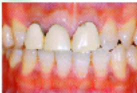
硬質レジン前装冠